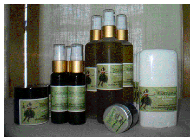
Baumes et huiles diverses sont au nombre des produits offerts chez ÉkôChanvre.

Vous vous demandez quels produits sont actuellement disponibles chez